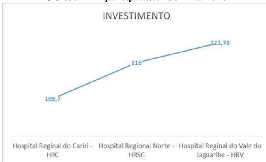
Gráfico 02 – Em que hospital teve maior investimento

As informações referentes aos anos de 2008 e 2009 não estava disponível no portal da transparência, nos anos de que as empresas em estudo são gerenciadas de forma leiga, haja vista que apenas uma tem profissional de nível superior formado na área, e mesmo assim, não faz planejamento financeiro.